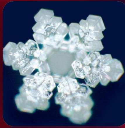
تأثیر موسیقی بر روی آب