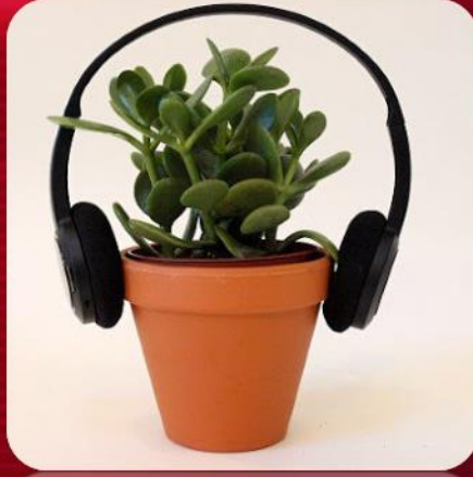
تأثیر موسیقی بر رشد گیاهان