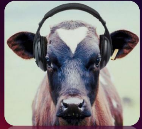
موسیقی و افزایش شیر گاو