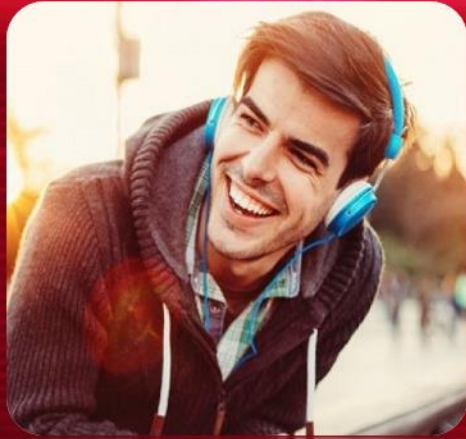
تأثیر موسیقی بر افزایش راندمان کار